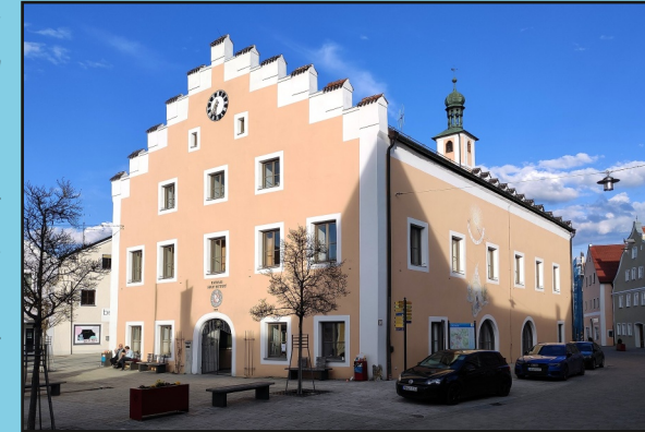
Rathaus Dietfurt